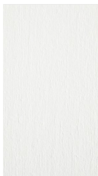
B5 buk/Buche/beechn biały/weiß/white