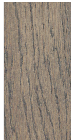
O4 dąb/Eiche/oak szarobrzowy/grau- braun/gray-brown