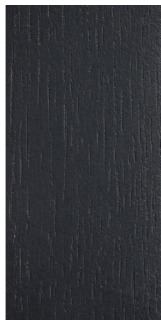
O3 dąb/Eiche/oak czarny/schwarz/ black