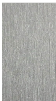
B6 buk/Buche/beechn szary/grau/gray