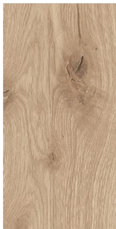
O1 dąb/Eiche/oak naturalny/natürliche/ natural