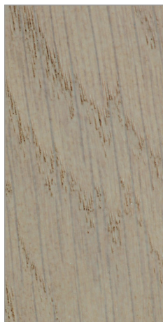
O2 dąb/Eiche/oak bielony/gebleichte/ bleached