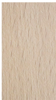
B2 buk/Buche/beechn bielony/gebleichte/ bleached